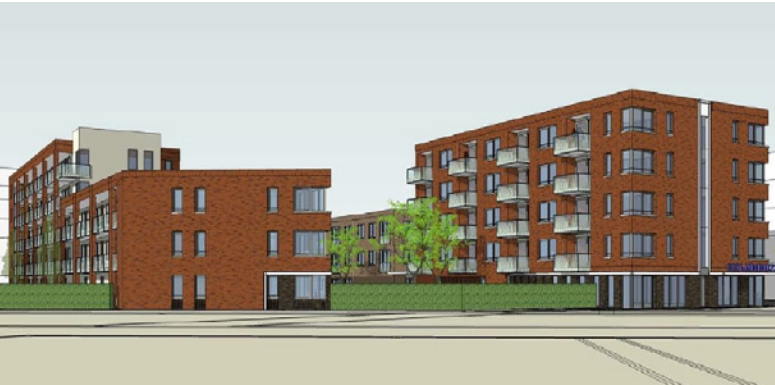
Gezicht vanaf winkelcentrum, met rechtsonder Columbuzz.

Het wooncomplex, dat hier al sinds 2009 staat en een tijdelijke bestemming zou hebben, blijft definitief staan. Een deel van de nieuwe woningen wordt hier tegenaan gebouwd. Op het terrein tegenover het gezondheidscentrum komen 34 appartementen.